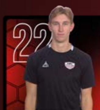
LOVE SUNDEWALL #22 - V6